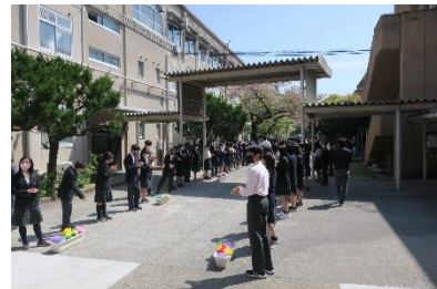
新入生歓迎会の様子