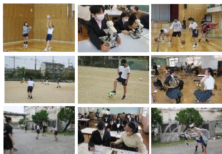
1年生の仮入部の様子

4月11日(月)には部活動紹介が行われ、その日の放課後から仮入部が始まりました。1年生は、自分の興味のある部活動に体験に行っていました。また、12日(火)には新入生歓迎会が行われました。今年度は1年生のみが体育館に入り、2, 3年生のビデオによるプレゼント、執行委員による委員会の説明、記念品の贈呈がありました。最後に2, 3年生が中庭に花道を作りました。