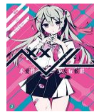
ベノム 求愛性少女症候群 城崎【著】、 かいりきベア【原著】 ※生徒リクエスト