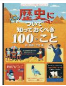
歴史について 知っておくべき100のこと ローラ・コワン、フェデリコ・マリアーニ 【画】、 ※生徒リクエスト