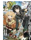
失格紋の最強賢者 3・4巻 進行諸島【著】 ※生徒リクエスト