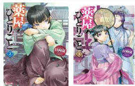
築屋のひとりごと 2・3巻 日向 夏【著】※生徒リクエスト