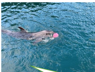
壱岐島ではかわいいイ ルカが見られます♪