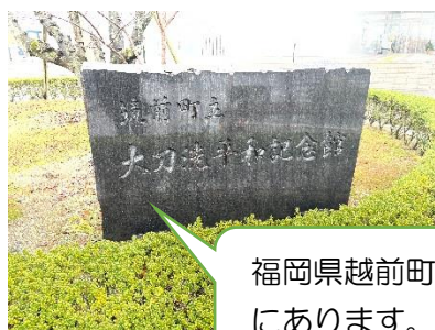
福岡県越前町 にあります。

1月22日（金）のKHの時間から修学旅行の事前学習が始まっています。コロナ禍におきまして、日程・場所などは変更になる可能性もありますが、いよいよ修学旅行に向けての取り組みが始まりました。2年生の間は、テーマ別のグループごとの調べ学習を中心に進めていきます。3年生に入ったら、修学旅行のスローガンを決めたりしおりを作成したりとたくさん決めていかなければならないことがあります。みんなで協力して、よい修学旅行にしましょう！