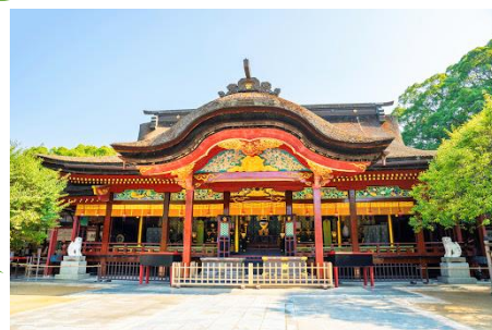
大宰府天満宮にも 行きます。