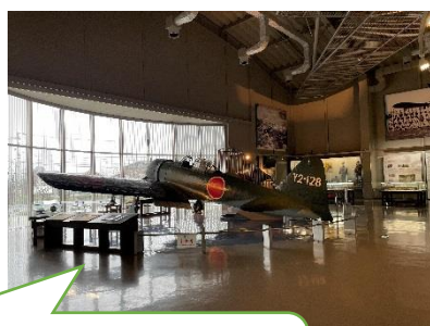
現存している唯一のゼロ戦 を見ることができます。