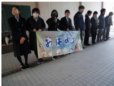
KKPの幼稚園が作成した横断幕を持つての挨拶運動