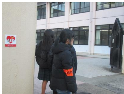
PTAの方と一緒に・・・

3年生の皆さんは、礼儀作法の練習や返答内容を準備して、26日に模擬面接を行いました。2月に入ると入学試験・学力検査が本格的に始まります。面接がある人も多くいると思います。清潔感溢れる身だしなみを心がけ、入退室時には、きびきびとした言動で挨拶を行いましょう。誠実な姿勢で対話を行えば、あなたの「人となり」が伝わり好印象を与えることができます。堂々とした態度で臨んでください。学力検査で日頃の成果を発揮してくれることと共に、健闘を祈っています。