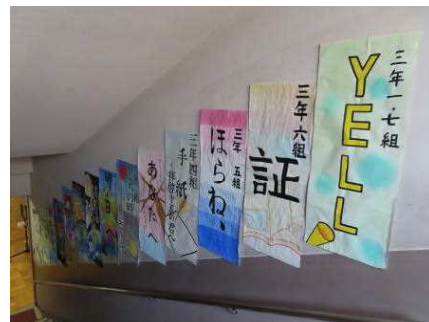
合唱コンめくりプログラム

次は進路に向けてとなりますが、懇談会での話をもとに、この後の約1ヶ月、将来のことや卒業後の進路先のことについて、お子たちの考えに耳を傾けていただきながら、十分にお話し合いをしていただきたいと思います。よろしくお願い致します。