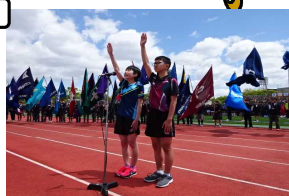
そう 僕ら これから別々の道を歩いて