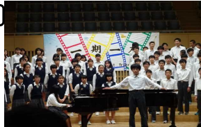
みんなの笑顔が 背中押すだろう

未来のことはわからない。しかし、われわれには過去が希望を与えてくれるはずである。