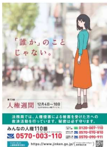
第73回人権週間ポスター