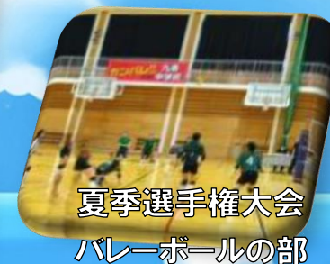
夏季選手権大会 バレーボールの部