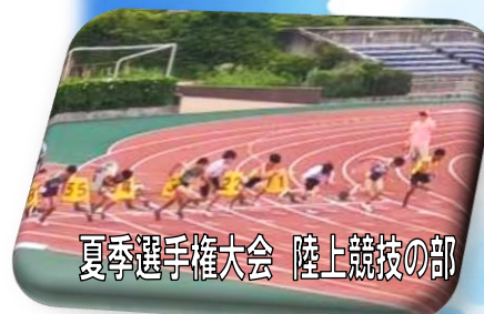
夏季選手権大会 陸上競技の部