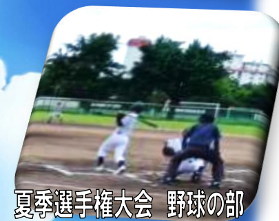
夏季選手権大会 野球の部