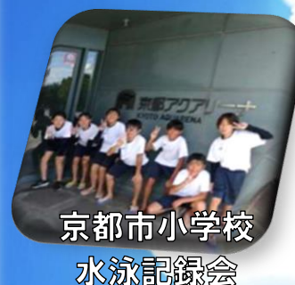
京都市小学校 水泳記録会