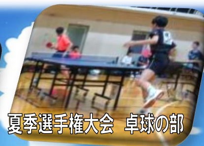
夏季選手権大会 卓球の部