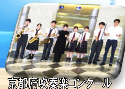
京都府吹奏楽コンクール