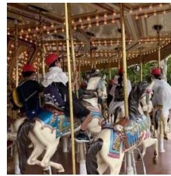
パルケエスパーニャ