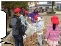
5 年生 地域清掃

1 1 月 2 7 日（水）の 5 年生「地域清掃」では、地域女性会の皆様をはじめ、PTA の方々、また、伏見住吉幼稚園や住吉西保育園の年長さんたちと一緒に地域清掃に取り組みました。疏水沿いの道や大きな歩道、住吉公園などに落ちているごみや落ち葉を丁寧に拾い、校区をきれいにすることができました。集まったゴミや落ち葉の多さに驚く子どもがたくさんいました。