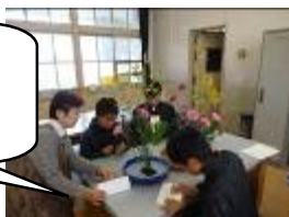
6 年生 伝統文化体験

1 1 月 2 0 日（水）・2 1 日（木）の 6 年生「伝統文化体験」では、地域女性会の皆様に多数お越しいただきました。2 日間に渡り、「生け花体験」「おぼんざいづくり」「着付けとお茶体験」「水墨画体験」に取り組んだ子どもたち。普段はなかなか体験することができない伝統文化に触れ、たくさんのことを学ぶとともに、さらに伝統文化についてくわしく知りたいという意欲も湧いてきました。子どもたちには、日本に受け継がれる伝統を大切にすることをこれからも大事にしてほしいと思います。