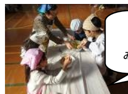
2 年生 おいもパーティー

5 年生と 6 年生はこの学習のあと、総合的な学習の時間でそれぞれテーマをもって調べたりまとめたりする学習をしています。最後になりましたが、お世話になりました皆様、子どもたちの学習を支えていただきありがとうございました。