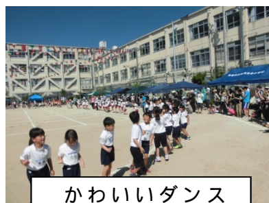
かわいいダンス （保幼小合同）

また、『かわいいダンス』では、伏見住吉幼稚園・住吉保育園・住吉西保育園と1年生とが合同で演技を披露しました。みんな一生懸命楽しそうに踊っていました。合同で、しかも大人の人たちが見ている中で演技をさせていただくことは子どもたちにとって本当にいい経験です。このような機会をいただいたことに感謝いたします。