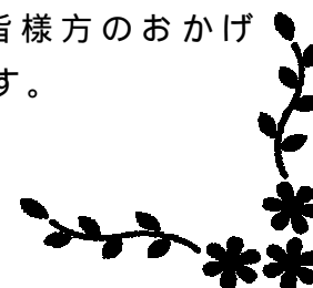
令和2年度 8月行事予定 京都市立伏見住吉小学校

夏季休業中は午前8時30分から午後5時までを電話対応時刻とさせていただきます。お知りおきください。