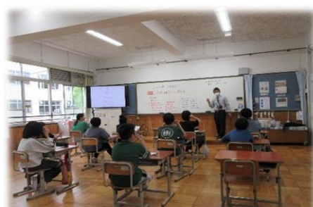
【6年生の学習の様子】