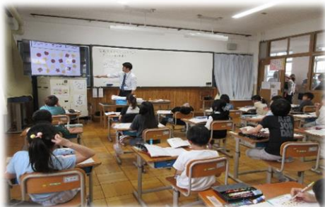
【2年生の学習の様子】

また、懇談会では新しいクラスでの子どもたちの様子やご家庭での様子、これから本校ならびに各学級が目指していく方向性などを話し合い、とても有意義な時間となりました。懇談会は、学校と保護者の皆様をつなぐ場だけではなく、保護者の皆様どうしがにつながる場でもあります。お忙しいとは思いますが、今後もぜひ参加していただきますようお願いいたします。