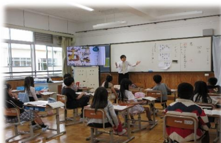
【3年生の学習の様子】