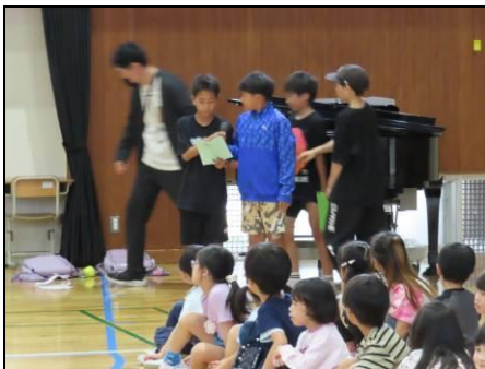
司会・はじめの言葉

5月13日(水)の3校時に、「1年生を迎える会」を行いました。2年生から6年生がお迎えの言葉や歌・ダンス・寸劇などを1年生に向けてプレゼントし、最後に1年生からお礼の気持ちを歌で表しました。温かい思いのあふれる1時間になりました。(写真は発表順です)