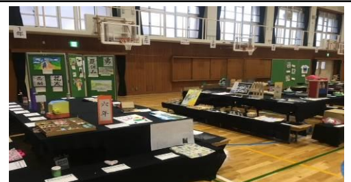
過去の会場の様子

今年も地域交流作品展を開催する予定です。地域や保護者の方々の作品を募集させていただきますので、よろしくお願いいたします。 8月29日までに学校へお持ちください。