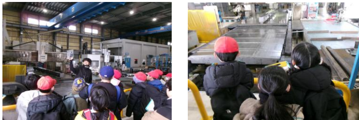
【ダイハツ自動車京都工場】