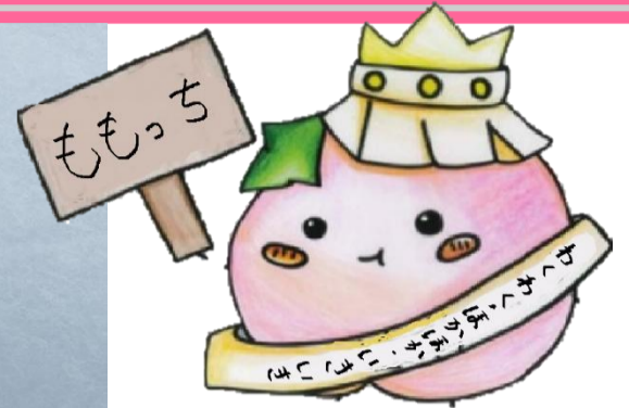
～ももっち～ 児童考案キャラクター