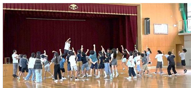
いきいきスポーツフェスタ 応援団の練習の様子 自ら希望して盛り上げてくれます

さて、「 高め合う 」という言葉。これは、本校教育目標の核であり、子どもたちが人とかかわりながら、よりよく、より豊かに成長していくための大切な原動力です。この力を培う具体的な手段の一つとして、先月より「 いきいきスポーツフェスタ 」に取り組んでいます。仲間と力を合わせて競技・演技に取り組むことで、一人では決して得られない達成感や協働的な学びの経験を積み重ねています。