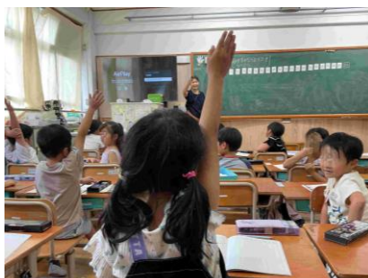
わくわくほかほかいきいき した 授業づくり 主体性や対話力向上 に向けた 授業づくり を進めています