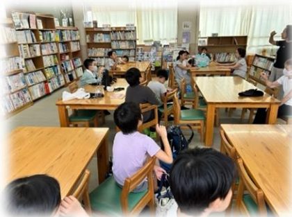
そろばん部の様子