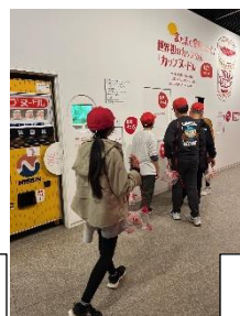
カップヌードル ミュージアム