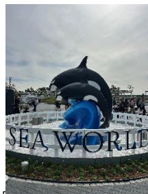
須磨シーワールド

6年生が神戸・姫路方面へ修学旅行に行きました。好天に恵まれ全行程を予定通り終えることができました。