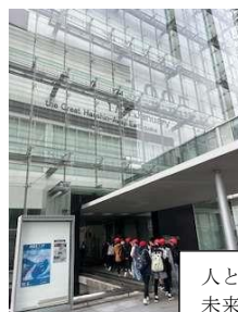
人と防災 未来センター