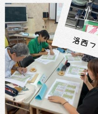
洛西フェスティバル