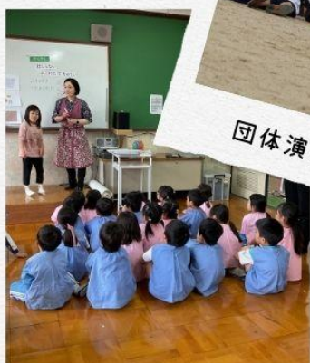
架け橋プログラム