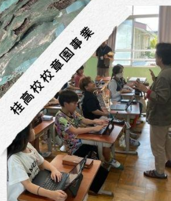
ゲストティーチャー