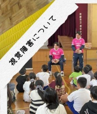
ラフビー出前授業