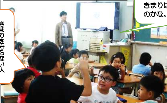
2年生「非行防止教室」