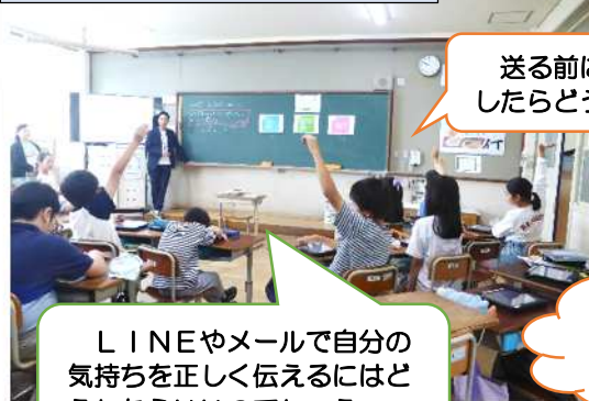
5年生「情報モラル教室」