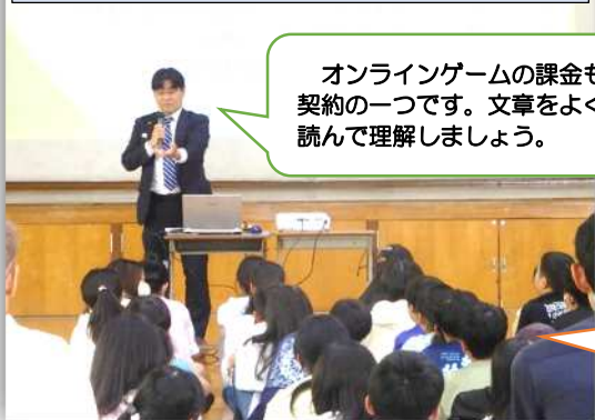
6年生 現役弁護士による「法教育」

本校の方針である「ほんまもん」外部協働の取組や、専科教員による授業の様子も参観していただきました。