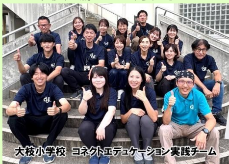
大枝小学校 コネクテッドエデュケーション実践チーム

この受賞を励みに、今後も子どもたちのために教職員一丸となつてますます尽力いたします。