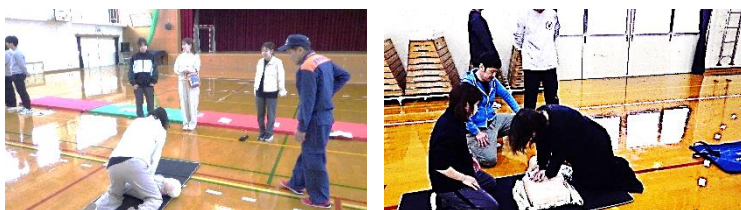
4月救急救命訓練の様子

次に、定期的に緊急時対応訓練も実施しています。これは、子どもに重大な事故が起こった場合を想定した訓練で、教職員と一体となって対応方法を確認します。具体的には、HANA モデルに沿って事故発生時の連絡手順や救急車の誘導等の確認、応急手当の実践などを行っています。