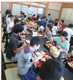
昼食：西の屋赤坂店 (12:00)