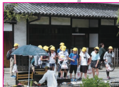
倉敷美観地区散策 (10:00)