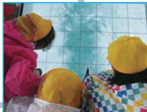
渦の道でうず潮見学(13:55)