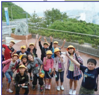
大鳴門橋をバックに(14:40)