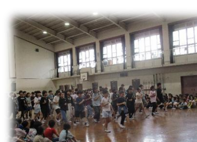
5年生からはリコーダーの演奏♪