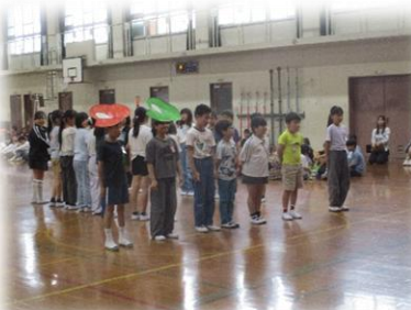
4年生からは正しい登下校を！