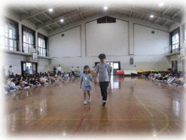
1年生入場！6年生と一緒に