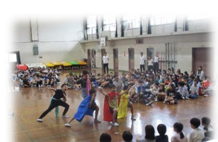
6年生からは6レンジャーが!!