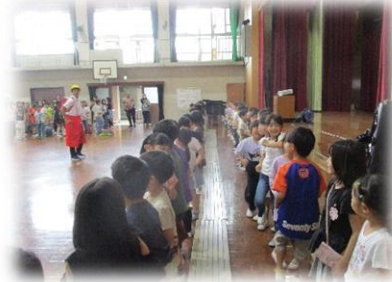
みんな一緒にめざめエクササイズ