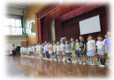
1年生もお礼の歌を歌いました♪