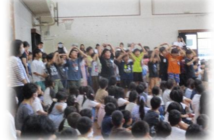
3年生からはハッピーソング♪