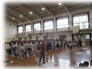
2年生からはうれしい!わくわく!だいすき!がいっぱいつまった歌とアサガオの種を!