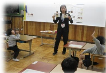
▲わかば 学活「1年間の行事を知ろう」