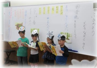
▲2年 国語「ふきのとう」