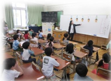
▲1年 国語「うたにあわせてあいうえお」