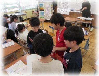
▲4年 国語「なりきって書こう」