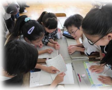
▲5年 国語「自分の名前を使って自己紹介」