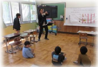
▲わかば1組「こののぼりをつくろう」