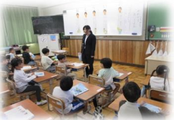
▲1年「うたにあわせて あいうえお」