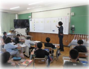
▲5年「漢字の成り立ち」