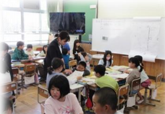
▲3年「学校のまわりの様子」