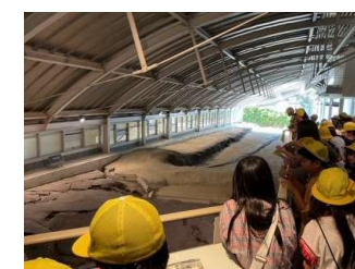
北淡震災記念公園