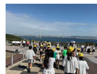
淡路サービスエリア