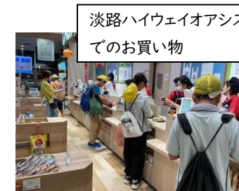
淡路ハイウェイオアシス でのお買い物