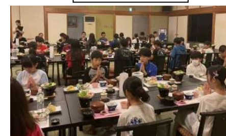
淡路島海上ホテルにて 夕食