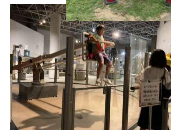
あすたむらんど徳島