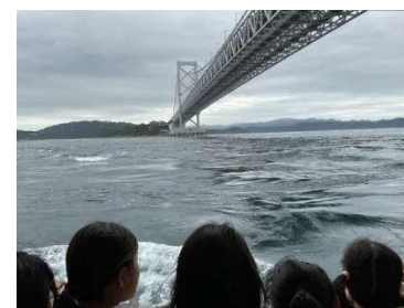
観潮船での渦潮見学