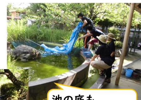
池の底もみがきました。