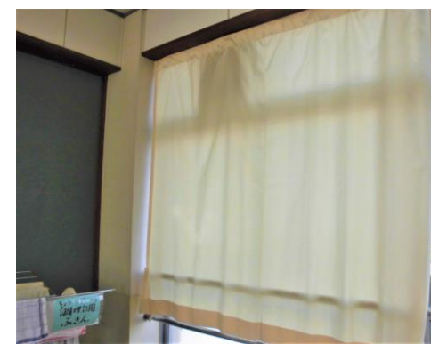
PTAさんにきれいにしていただきました。