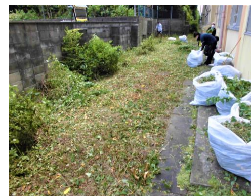
すっきり、明るくなりました。

梅津小学校は歴史ある学校です。校内の「もの」を大切に使い、みんなが気持ちよく過ごせる学校にしていきたいと思っています。