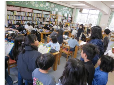
マンガ・美術クラブ