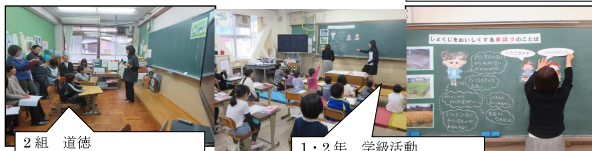
2組 道徳 マラソン大会 最後まであきらめずに努力することについて考えました。