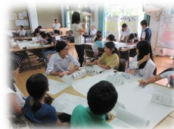
6校小中合同生徒会・児童会会議