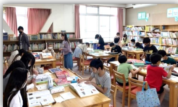
みんな真剣！そして、とても面白そうです！

お子さんが持っている「読書ノート」には、学年ごとに学習のチャレンジ目標があるのをご存じですか？ 1.2 年生は図鑑の使い方を。3.4 年生は百科事典の使い方、5.6 年生は年鑑や統計資料の使い方です。 図書室では、学校司書の先生からのお題を元に、実際に調べ学習も行われています。