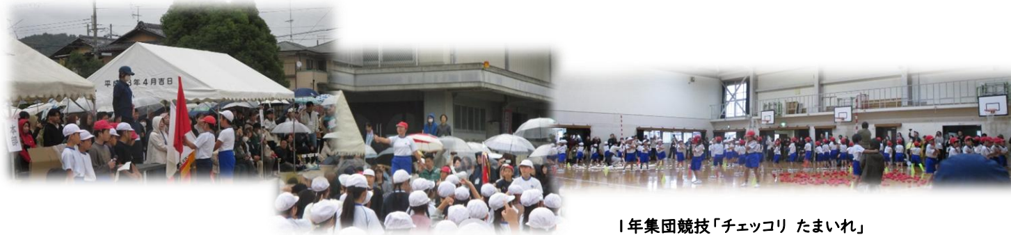
開会式・準備運動

あいにくの天候でしたが、運動会「短縮プログラム」で団体競技・演技をすることができました。 11月6日(木)1校時に「徒競走の部」を行います。