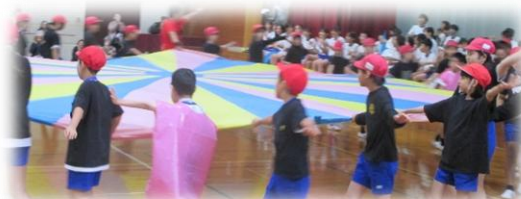
あおぞら学級・5年「トライ！トライ！バルーン」