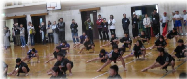
4年集団演技「70人でソーラン&そでふれ ～心1つに 全力パフォーマンス！～」