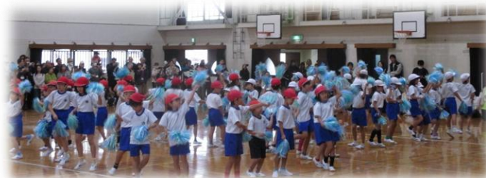
2年集団演技「にこにこピースで レッツパーティー☺」