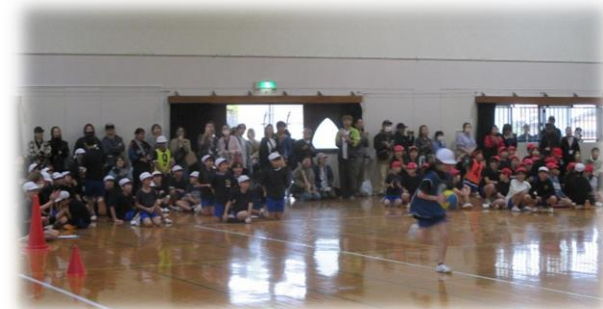
5年集団競技「キャッチでGO！ ～POWER☆BALL5～」