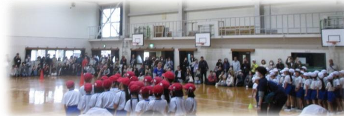
3年集団競技「台風なんてふきとばせ！ 3シャイン★リレー」