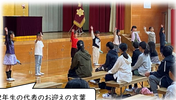
2年生の代表のお迎えの言葉

4月10日(水)、新しい教職員と新しい1年生53名を迎え、令和6年度がスタートしました。 入学式では、1年生が校長先生の話をしっかり聞き、教室では元気に返事をしていました。これから、勉強も行事を通して、広沢小学校での生活を楽しんでいってほしいと思います。