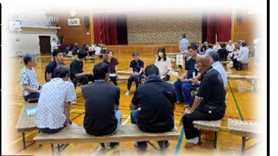
学校運営協議会総会の様子

!印は、令和5年度後期よりも3%以上、「そう思う」「だいたいそう思う」という回答が増えた項目。