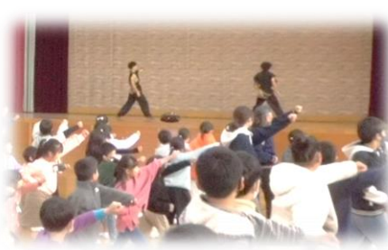
伝統文化鑑賞・体験「京炎そでふれ」