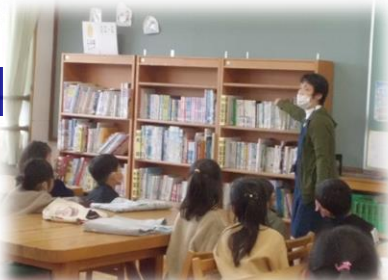
学校図書館での学習

「⑩進んで読書をしていますか。」「⑫自主学習に進んでとりこんでいますか。」という項目で、今回のアンケート結果は「そう思う」「だいたいそう思う」の児童・保護者の回答率が上がっています。読書については、第2学校図書館を作って活用しやすしたり、学校司書の読み聞かせを行ったり、国語科での並行読書を積極的に進めたりしてきました。自主学習については、子ども達の学習のがんばりを、廊下等に掲示し、めざす自主学習を示してきました。それらの成果が表れてきたのではないかと思います。