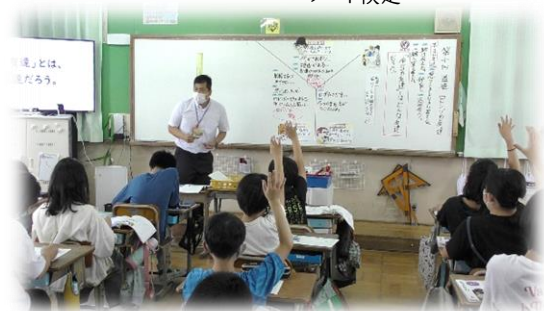
道徳の授業の様子

また、今年度は、これまでの算数科での授業研究に加え、特別の教科道徳についても授業研究に取り組んできました。「進んで自分の思いや考えを伝え合う」ことを大切にしてきたことが道徳の授業でも発揮され、思いや考えを出し合って学習を深めることができています。その成果を、今年度は、「右京北支部人権教育(道徳)授業研修会」で、右京北支部の学校のたくさんの先生方にも見ていただきました。今後も、自分の思いや考えを伝え合うことを大切に授業づくりをしていきたいと思っています。