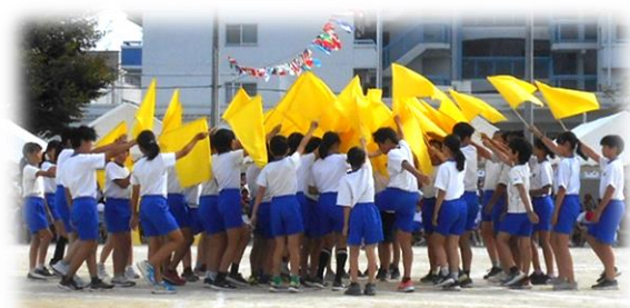
運動会6年集団演技

今年度、コロナ禍が落ち着き、さまざまな行事や交流が行えるようになりました。4年ぶりに全校が一堂に会しての運動会では、各学年が短い練習期間でも学年の団結力を発揮し、達成感を味わうことができました。地域の方やさまざまな専門家をゲストティーチャーにお迎えし、いろいろな話を聞き、体験をすることで、努力することの大切さを学んだり、将来の自分の姿をイメージしたりする機会をもつことができました。このような経験が、レジリエンスの育成、夢や希望をもつことにつながるのではないかと考えています。3学期も、さらに実現できるようにしていきたいと思います。