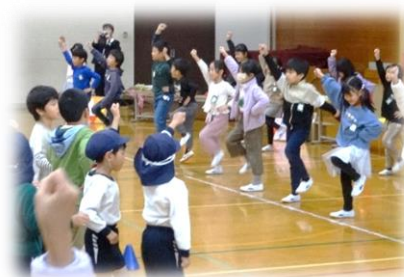
保幼小交流会「あきパーティー」