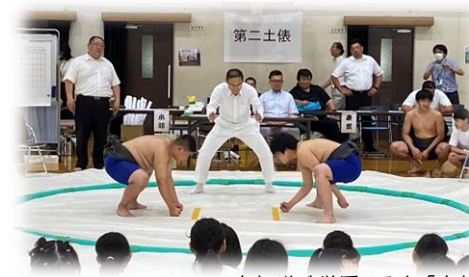
京都嵯峨学園の取組「京都嵯峨学園3校交流子どもすもう大会」

今回のアンケート結果では、「そう思う」「だいたいそう思う」の回答率がどの項目でも高くなりました。コロナ禍が落ち着き、今年度は「京都嵯峨学園3校交流子どもすもう大会」が開催されるなど京都嵯峨学園での取組を開催することができました。また、創立50周年を迎え、地域の方々とともにさまざまな事業や式典を行いました。地域の方々に学校に来ていただいてお話を聞いたり交流をしたりすることもできました。今後も、京都嵯峨学園(小中連携)の取組を大切にし、地域の方々のご協力をいただきながら、子ども達の教育活動を進めていきたいと思ひます。どうぞよろしくお願いいたします。