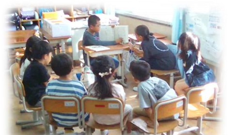
にこにこなかよしグループ読み聞かせ

学校では2学期に、にこにこなかよしグループでの読み聞かせを行いました。5・6年生が、下級生が楽しめる本を選んで、読み方を工夫して読み聞かせをしました。読書の楽しさを知り、新たな本と出合う機会になったのではないかと思います。このような取組を増やし、子ども達が進んで読書や自主学習に取り組んでいけるようにしたいと思います。