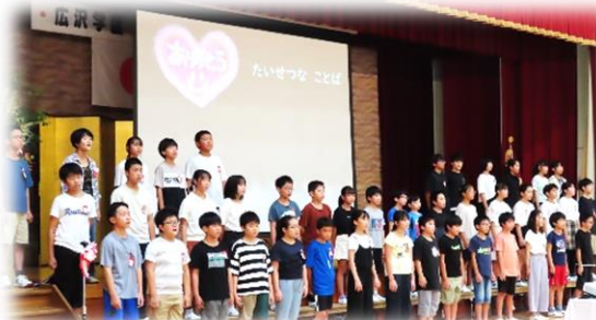
広沢学区・広沢小学校 創立50周年記念式典