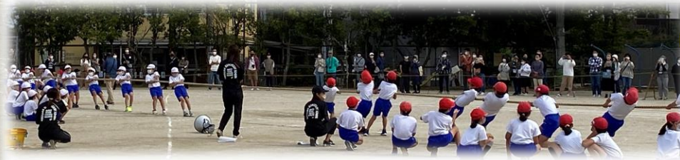
5年集団競技「Let's go!つな引き」