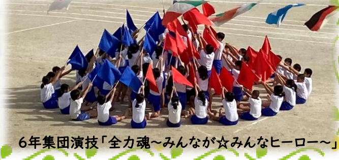
6年集団演技「全力魂～みんなが☆みんなヒーロー～」