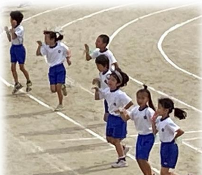
2年集団演技「いろとりどり2年生」