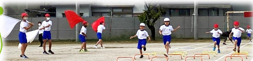
1年バリエティ走「びよん びよん びよん ゴールをめざして はしりぬけ！」

今年度も、低・中・高学年に分けての運動会でしたが、たくさんの保護者の方の拍手や教室からの声援・拍手も聞こえ、心をひとつにして運動会を楽しみました。