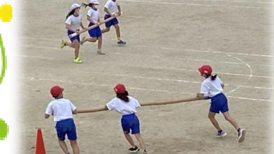
3年集団競技「未来を探そう!!グルグル大作戦！」