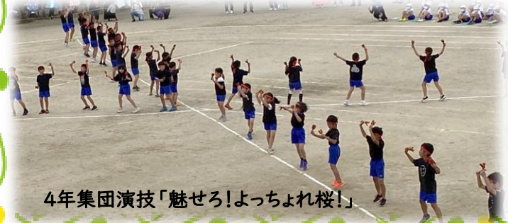
4年集団演技「魅せろ!よっちょれ桜！」