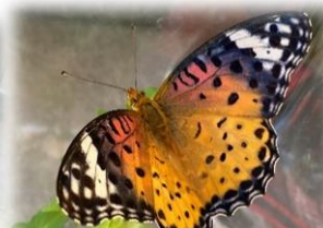
みんなで成長を見守った ツマグロヒョウモン