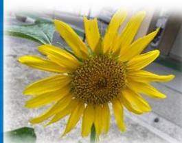
学校園で咲いた ひまわり

そのため、7月末から8月中旬は、職員室付近は立ち入り禁止になります。来校された場合、教職員は職員室ではない場所にいることがありますので、その場合は掲示にてお知らせするようにします。ご不便をおかけしますが、よろしくお願いします。