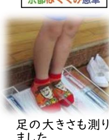
足の大きさも測りました