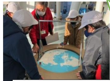
あすたむらんど徳島