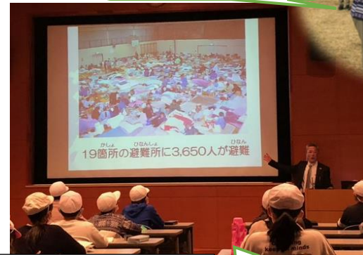
北淡震災記念公園