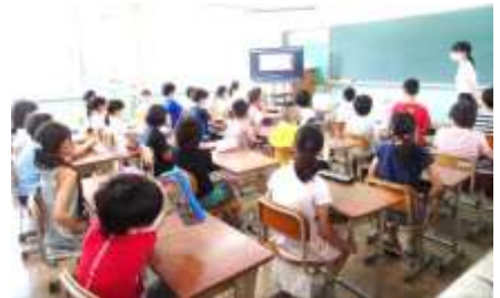
(テレビ放送での朝会)