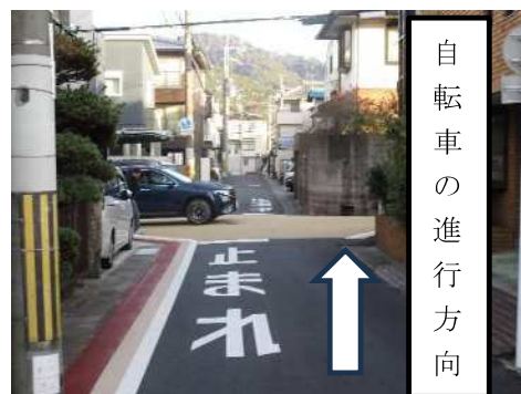
事故のあった交差点の様子

先日、学校北門から北に進んだ交差点で児童が乗った自転車と車との交通事故がありました。児童には大きな怪我はありませんでした。事故の現場は写真の通り自転車の進行方向には、「とまれ」の表示があり自転車は一時停止の必要があります。後日、四ノ宮交番の方から「(車は左側走行なので) 左方向、右方向を確認し、もう一度左方向を確認して交差点内に進む。」と教えていただきました。また、自転車の事故が自宅の近辺で起きる傾向があるため『自転車に慣れても、道には慣れるな』と伝えたい。」とお聞きしました。子どもたちに心がけてほしい言葉です。自転車に乗る時は、「初めて通る道のように慎重に安全に」を意識してほしいと思います。