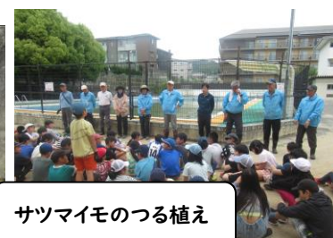
サツマイモのつる植え