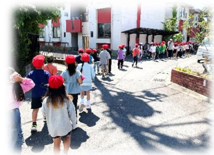
3年生：社会見学「京都タワー」