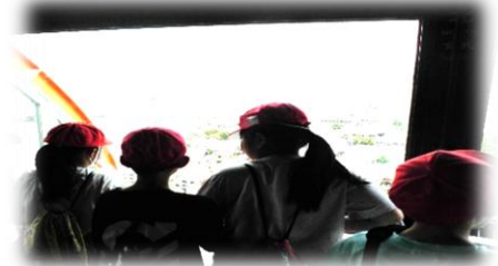
4年生：社会見学「蹴上浄水場」