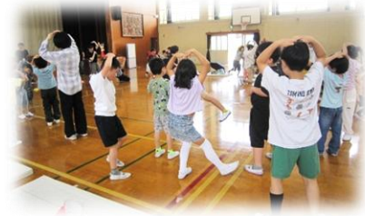
1年生：生活科、アサガオのタネ植え