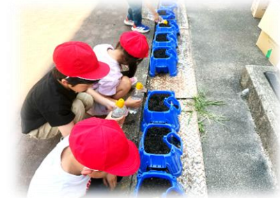
2年生：生活科、町探検