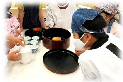
6年生：京都薬科大学の先生との薬物乱用防止教室