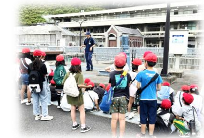
5年生：家庭科、お茶入れの実習