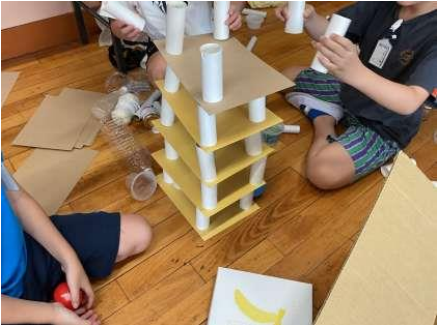
2年生:生活科で遊んで作って工夫しています。