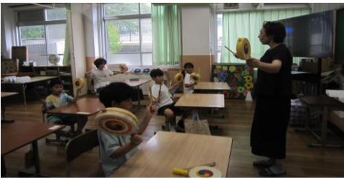
たいよう:韓国朝鮮の楽器について学びました。