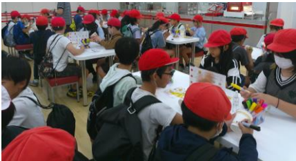
5年生:社会の学習で工場見学に行きました。