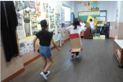
3年生:総合的な学習の時間で、じゅんかんバスについてまとめています。