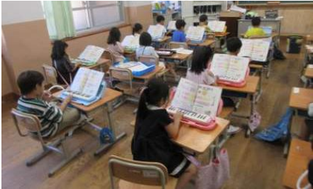
1年生:音楽で鍵盤ハーモニカの練習をしています。