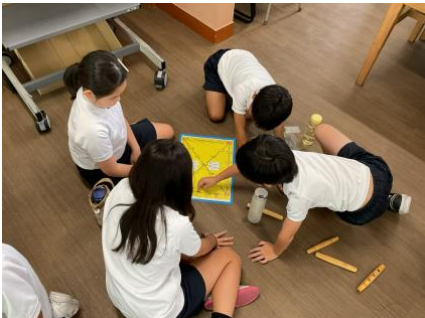
4年生:韓国朝鮮の遊びを体験し学習しました。