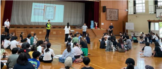
6年生:総合的な学習の時間で地域の方や区役所の方と一緒に学習しました。