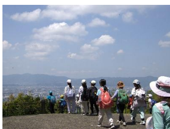
【3年 校外学習(将軍塚)】