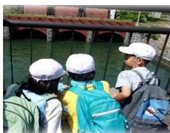
【4年 校外学習(小関越え)】