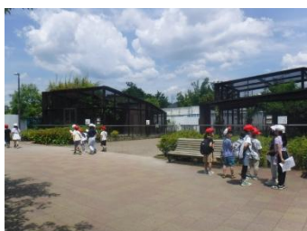
【1・2年 春の遠足(動物園)】