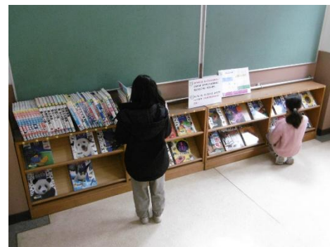
【階段の踊り場の配架】