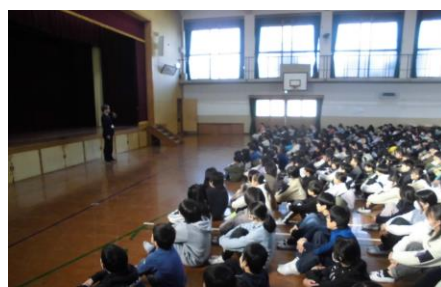
人権集会を行いました！

本日、3学期の始業式を行いました。子どもたちの元気な声が学校に戻っています。3学期は一年間で最も短い学期ですが、現在の学年のまとめを行い、新たな学年に向けての準備を整えるとても重要な時間です。自分の課題と向き合い、大きく成長してくれる姿を楽しみにしています。