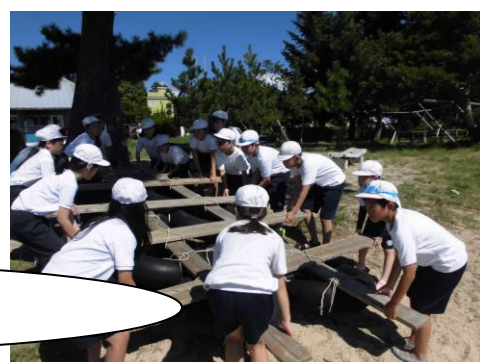
4年生 びわ湖青少年の家