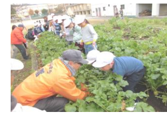
2年生「抜くのが難しい！」