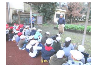
1年生「話をしっかり聞きます。」