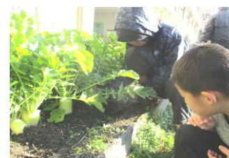
こすもす学級「協力して・・・」

昨年も地域の先輩にお世話になり、なかよし菜園に育った大根を収穫しました。毎年、冬に向けて種を植え、間引きを行い、収穫をします。学校で育てた大根はとて大きくて立派な上に、甘くてとてもおいしいので子ども達も毎年楽しみにしています。こんなに大きく成長しているのは、経験豊かな地域の先輩が愛情を込めて、毎日様子を観察し、水やりや手入れを行ってくださっているからです。19日に開催されるPTA昔遊びとおもちつきの会でも、お味噌汁に入れていただきます。販売もありますよ！実際に土や大根に触れて自然そのものを感じ、食べ物をいただくということに感謝して、大きく育った大根をしっかりと味わってくださいね。