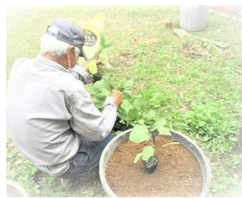
山科茄子はビデオでの学習になりました。