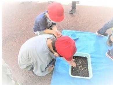
粃を蒔いて苗を育てます。

山階小学校では、地域の方々にご支援いただき、「なかよし菜園」での栽培活動をしています。まずは、3年生が「赤米」を育てる活動をサポートしてもらいました。粃を蒔き、苗を作ります。今後、代掻き、田植え、稲刈り、脱穀と続きます。全てを支援していただきます。ありがとうございます。そして、山科茄子の植付け（3年）、ジャガイモの収穫（こすもす・6年）、キュウリの苗植え（全学年）と続いています。子どもたちは水やりが主な仕事になります。キュウリはとてまたくさん収穫できるのでとても楽しみです。