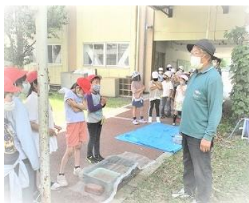
どのような過程で米ができるか教えてもらいます。