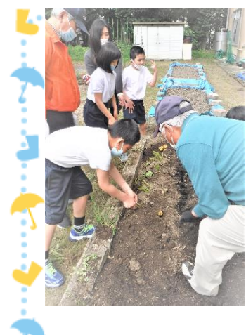
今年のジャガイモは大きく、食いもない立派なものでした。虫